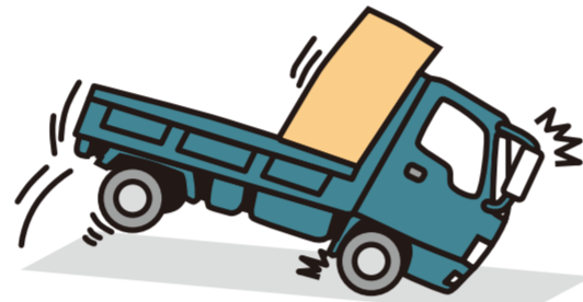
降坂時や急ブレーキをかけたときに、制動力不足が生じるおそれがある。