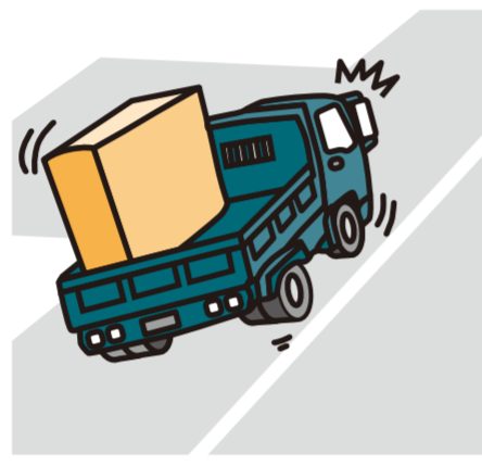
カーブ走行、右左折、傾斜路面走行時に横転する危険がある。