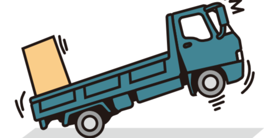
発進時や登坂走行時、踏切通過時に、ハンドルが不安定になったり、頭が持ち上がってしまうことがある。