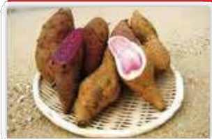
サツマイモ(紅イモなど) の生塊根