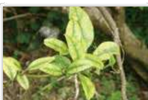
カンキツグリーンング病菌 (病気の症状)