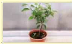
カンキツ類の苗木

詳しくは、事前に裏面★印の植物防疫所にお問い合わせください。なお、現在小笠原諸島には蒸熱処理施設がありません。