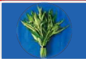
エンサイ(空心菜・ウンチェーバー) の生茎葉