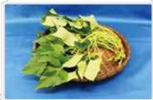
サツマイモ(紅イモなど) の生茎葉