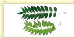
オオバゲッキツ (カレーリーフ)の生茎葉